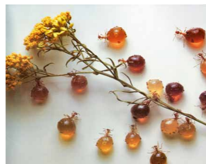
Diese Ameisen füllen ihre Mägen mit Honig, bis sie sich aufblähen. Die Maya trockneten sie in der Sonne, Kinder verzehrten sie als Süßigkeit.

„Die Leute essen jeden Tag, zu Essen haben alle eine Beziehung“, sagt Sedlar. Vor allem, so hofft er, soll das Unterfangen zur Bildung junger Menschen beitragen, soll helfen, Diabetes und Fettleibigkeit zu bekämpfen. Die Küche der Ureinwohner Südamerikas, „Tamale Technology“, „Chileology“, „Xocolat“ – das sind die Namen einiger Ausstellungsräume, die das Museum beherbergen soll. Ein Ort dafür ist noch nicht gefunden, immerhin